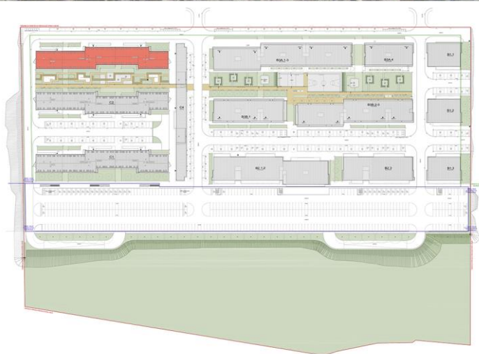
Sl. 5. Izgled i situacija realizovanog stambenog kompleksa, sa obeleženim objektom socijalnog stanovanja C3