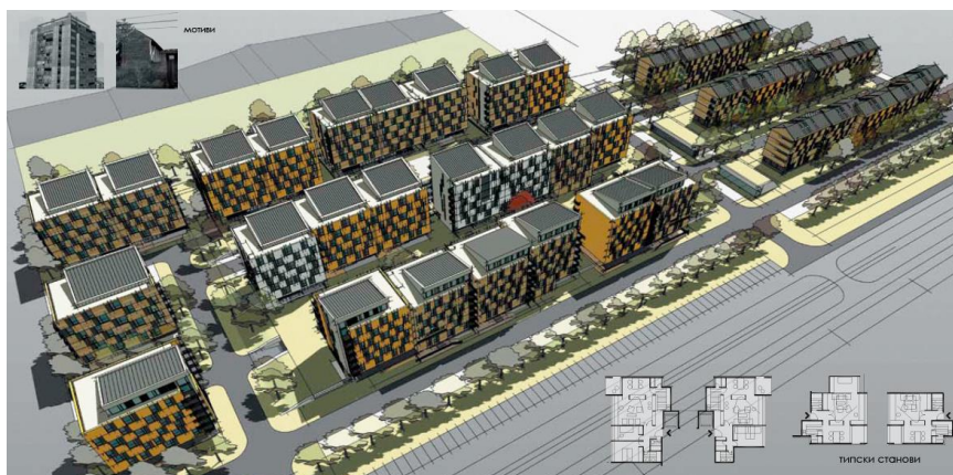
Sl. 4. Jednakovredna 1. nagrada (rešenje odabrano za realizaciju) (autori Tamara Petrović-Komlenić i Miloš Komlenić)

Prvonaagrađenim konkursnim rešenjem, a kasnije i kroz njegovu realizaciju, udeo socijalnih stanova povećan je u odnosu na prvobitno predviđenih 30%, te je projektovano čak 399 stambenih jedinica za ovu namenu. 14 Osim toga, ovo stanovanje sa mešovitim oblikom vlasništva konkursnim uslovima planirano je kao segregirani model – tzv. „model klastera”, sa striktno razdvojenim zonama socijalnog i neprofitnog stanovanja, što je nesumnjivo doprinelo izrazitoj socijalnoj polarizaciji stanara ovog kompleksa (Sl. 4, 5, 6). Iako su glavnim arhitektonskim projektom prostorno-funkcionalni standardi zgrada i stambenih jedinica u značajnoj meri unapređeni u odnosu na konkursno rešenje, problemi uočeni već u fazi programiranja i urbanističkog planiranja ovog stambenog kompleksa, a kasnije i upravljanja, ne samo što su značajno umanjili nivo održivosti i kvaliteta stanovanja, već su uticali na njegovu deprivaciju, getoizaciju i stigmatizaciju već tokom prvih nekoliko godina nakon useljenja sadašnjih stanara. Rezultati sprovedenog anketnog ispitivanja zakupaca socijalnih stanova u objektu C3 krajem 2016. godine ukazali su na pojavu problema nedovoljne bezbednosti i kriminala u ovom kompleksu, što se može dovesti u vezu, kako sa aspektima neodgovarajućeg upravljanja strukturom korisnika, koju čine pretežno pripadnici romske populacije, tako i sa veličinom samog projekta, odnosno velikom koncentracijom socijalnih stanova (v. Bajić, 2017).