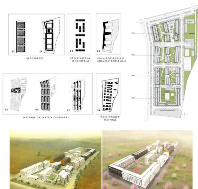
Sl. 7. Grafički prikaz metodologije rada – Ideje osam konkursnih radova implementirane u usvojeno urbanističko rešenje

Grad Beograd posredstvom Agencije za investicije i stanovanje raspisao je 2011. godine Konkurs za izradu idejnog urbanističko-arhitektonskog rešenja stambeno-poslovnog kompleksa socijalnog stanovanja u beogradskom naselju Ovča , kojim je predviđeno osmišljavanje stambeno-poslovnog kompleksa sa ukupno 1.400 stanova. Finansiranje projekta 1.200 socijalnih stanova predviđeno je iz donacija obezbeđenih iz evropskih fondova, dok je izgradnja 200 stanova solidarnosti planirana kao očekivani završetak Programa izgradnje stanova solidarnosti , sprovedenog kroz FSSI u Beogradu od 1990. do 2010. godine. Završetak konkursa bio je praćen elaboracijom sinteznog „postkonkursnog” urbanističko-arhitektonskog rešenja, u kojoj je učestvovalo osam nagrađenih timova („TIM 8”) 15 (Sl. 7), ali uprkos najavljivanju početka izgradnje, dobijeno rešenje do danas nije realizovano. U pitanju je, svakako, metodološki inovativan model domaće