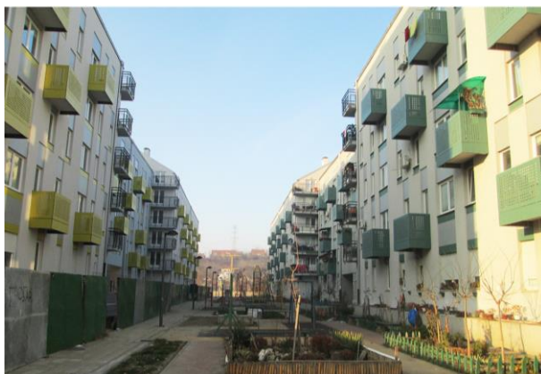
Sl. 6. Objekti socijalnog stanovanja – C3 (desno) i novoizgrađeni objekat C2 (levo), fotografija iz 2016. godine